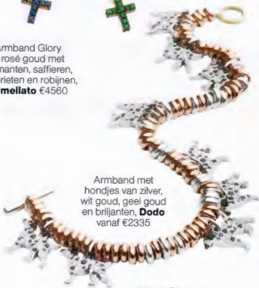
Armband met hondjes van zilver, wit goud, geel goud en briljanten, Dodo vanaf €2335