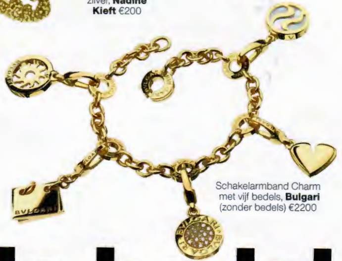
Schakelarmband Charm met vijf bedels, Bulgari (zonder bedels) €2200