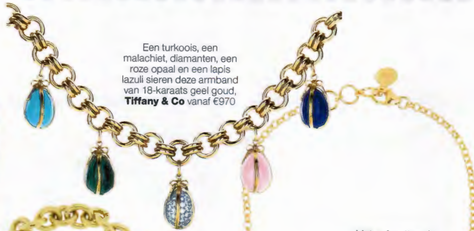
Een turkoois, een malachiet, diamanten, een roze opaal en een lapis lazuli sieren deze armband van 18-karaats geel goud, Tiffany & Co vanaf €970